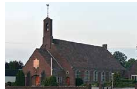
De Westerkerk, elke zondag om 9:30 uur