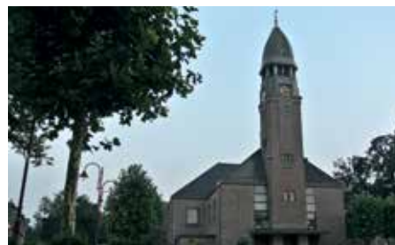
De Grote Kerk, elke zondag om 9:30, 14:30, 19:00 uur