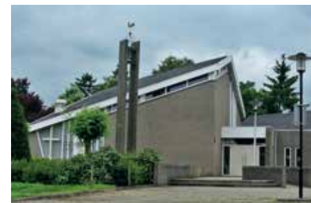
De Aakerk, elke zondag om 10:00 uur