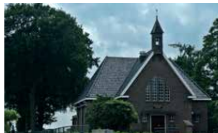
De Pollenkerk, elke zondag om 9:30 uur

De kerk is het huis van God. Tijdens de erediensten op zondag mogen we daar samenkomen om Hem te eren, te lofprijzen en te luisteren naar Zijn woord. Een levende gemeente is daarvoor de basis. We ontmoeten dus ook elkaar tijdens de erediensten. Binnen onze gemeente zijn er een aantal kerken met elk eigen erediensten. Je bent van harte uitgenodigd.